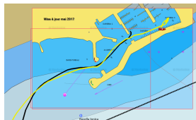
passes-3.png PNG - 135.8 ko 1024 x 615 pixels