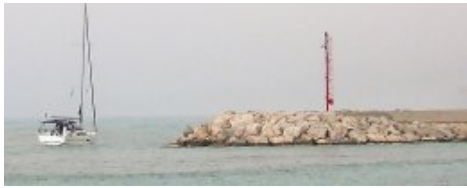
Revenir à terre