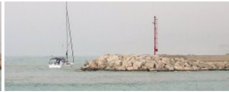
Se diriger vers la plage