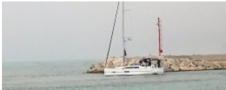
Passage de sortie jetée N