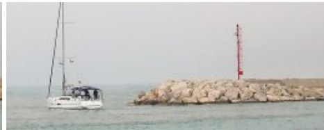
Amorcer le virage