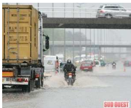
Inondation de la rocade bordelaise

Extrait du forum discussion du site de la SMF www.forum-smf.org